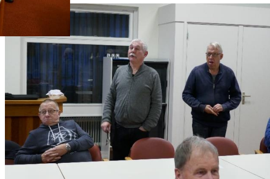
Heren, mag ik even! Dank en tot ziens (in Lv).