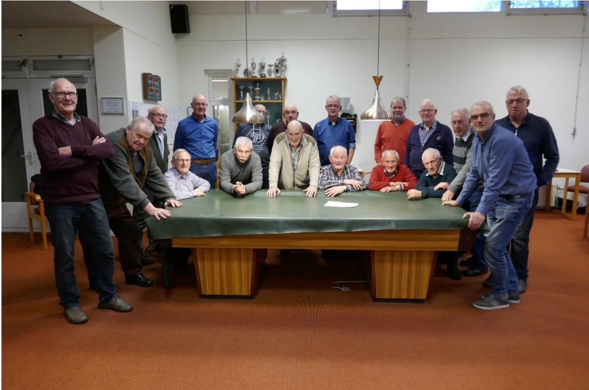
Groepsfoto van de spelers uit Wijhe en Lemelerveld. De fotograaf ontbreekt.