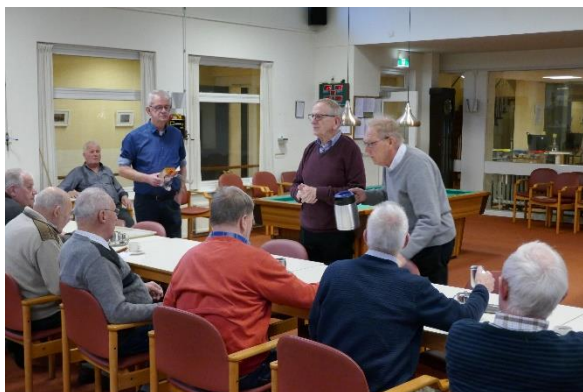
Welkom in Wijhe, uiteraard eerst koffie.

Enkele foto's van de biljartwedstrijd Wijhe – Lemelerveld op vrijdag 8-2-2019 in het Weijtendaal.